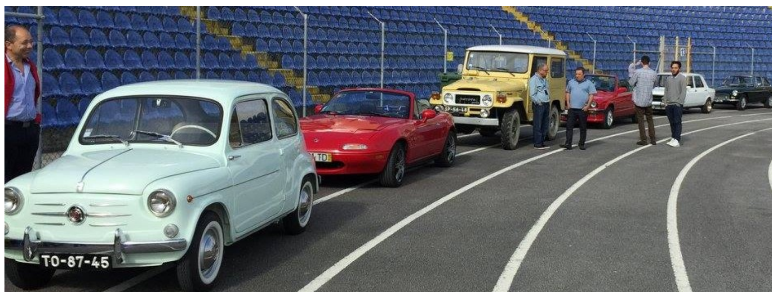
MAIS DE 50 VIATURAS NO SEGUNDO PASSEIO DE CLÁSSICOS (PÁG.3)

DESFILE DE MODA SOLIDÁRIO REÚNE MAIS DE 400 PESSOAS NA FREGUESIA DE SANDE E S. LOURENÇO DO DOURO