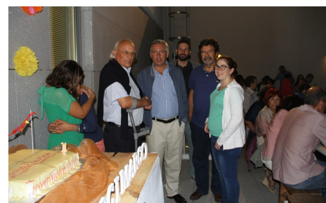
Noite da Francesinha levou mais de 250 pessoas ao Complexo de Alpendorada (fotos acima)