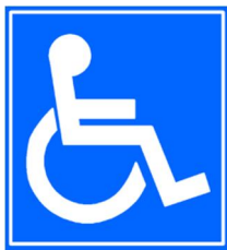
Símbolo Internacional para Acessibilidade

Assim, a acessibilidade significa a possibilidade de acesso de todas as pessoas ao meio edificado, à via pública, aos transportes e às tecnologias de informação e comunicação, com o máximo possível de autonomia e de usabilidade.